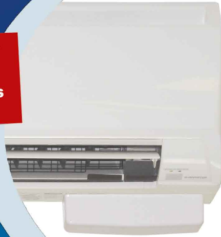
Yatay olarak alta