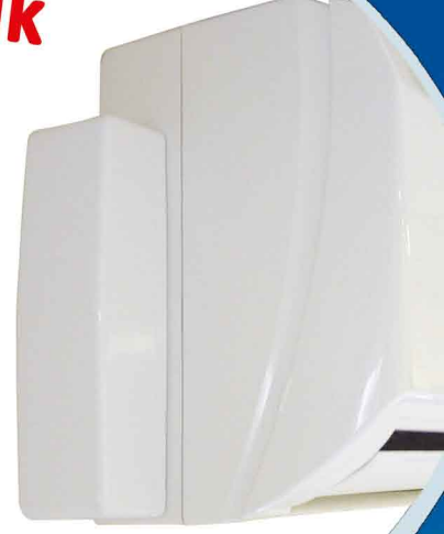
Dikey olarak yana